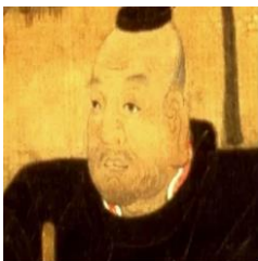
徳川家康の名言集

大将というものはな、家臣から敬われているようで、たえず落ち度を探されており、恐れられているようで侮られ、親しまれているようで疎んじられ、好かれているようで憎まれているものよ。